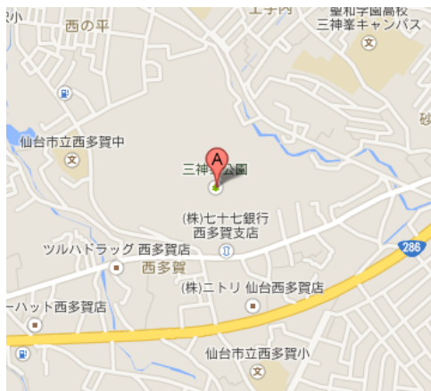
図 2(図 1 の黒枠で囲まれた部分)